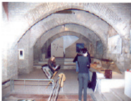
Bajos del palacio arzobispal. Tarazona (Zaragoza). Impresiones del Sonido II, (sonidos naturales y urbanos).

"Los intentos, muy conocidos, de ofrecer un equivalente cromático a la música y viceversa, tiene hoy un interés más que nada histórico, y de curiosidad psicológico-experimental. En efecto, los diversos instrumentos elegidos en tiempos pasados (como el Clavier à la lumière o el Clavecín oculaire) no tuvieron otra consecuencia que la de despertar periódicamente una cuestión ya de por sí descontada, al menos desde el punto de vista práctico. Subsistió el importante problema de acordar luces y sonidos, colores y tonos en circunstancias particulares, como en la escena, en ciertas ejecuciones rítmicas de danza o ballet; pero no es posible hablar a este respecto de verdaderas reglas que se impongan y que aconsejen el uso de un color más bien que de otro; o de un sonido o de un timbre preciso correspondiente a ellos. Continuaron, en cambio, y todavía prosiguen los estudios más o menos eruditos en torno del problema -más que estético, psicológico- de la sinestesia; hasta que punto existe y puede precisarse una analogía de respuesta a